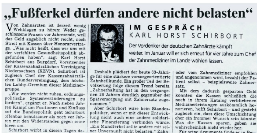
Abbildung 1 „Fußferkel dürfen andere nicht belasten“ So könnte eine Schlagzeile künftig heißen (Fotomontage unten), falls sich die Dermatologen auf das Niveau der Vertragszahnärzteschaft begeben, deren höchster Repräsentant im Jahr 2000 forderte: „Mundferkel dürfen andere nicht mit ihrer Unvernunft belasten“ [18]. (Tab. 1 u. 2, Abb. 1: H.J. Staehle)

tung der Bürgerinnen und Bürger geführt werden. Das Herausnehmen einer Behandlung von Fußpilzkrankungen aus dem Leistungskatalog der Gesetzlichen Krankenversicherung sei sowohl aus medizinischen wie auch aus ökonomischen Gründen dringend geboten. Der Vorsitzende der Kassenzahnärztlichen Bundesvereinigung unterstrich mit Hinweis auf andere Verlautbarungen [4], die Umsetzung dieser Forderung sei ein Testballon, der – bei entsprechendem Erfolg – auch auf andere medizinische Bereiche übertragen werden solle.