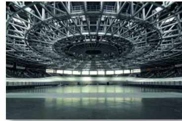
Das Velodrom in Berlin