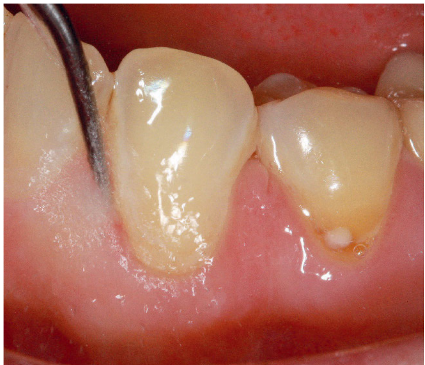
Abbildung 2 Subgingivale Instrumentierung mittels Schallinstrumenten