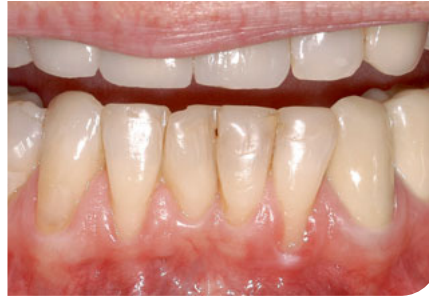
Abb. 3 Präoperativ Rezessionen an den Zähnen 32 und 42.

Welche Defekte müssen aus welchem Grund behandelt werden? Der Leidensdruck des Patienten und der Wunsch nach einer Therapie umfasst die empfindlichen Zahnhälse, ästhetische Beeinträchtigungen und die Angst vor dem Zahnverlust. Seitens des Behandlers ergibt sich die Therapienotwendigkeit aus dem erhöhten Risiko für Wurzelkaries und prothetischen Fragestellungen wie subgingivale Kronenränder.