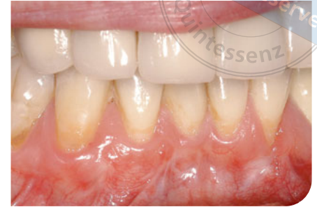
Abb. 5 Ergebnis 1 Jahr postoperativ.

um eine 100%ige Wurzeldeckung zu erreichen 3 . Die SZG muss nach Pini Prato und Kollegen um 2,5 mm überdeckt werden 12 (Abb. 3–5).