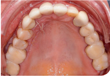
Abb. 2 Transplantatentnahmestelle am Gaumen.