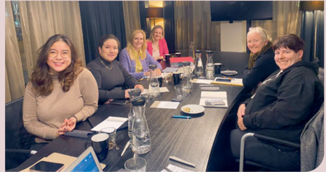
Klausurtagung des Dentista Vorstands im Januar in Berlin.

„Mehr Power von :innen“ wird uns auch weiterhin begleiten und wer Lust hat, kann diesen Spirit – neben dem dentista:kongress, der am 27. und 28. April in Berlin stattfindet und Euch ein spannendes Vortrag- und Workshopangebot bietet – auch auf einer Schiffsreise erleben: Wir sind vom 1. bis zum 5. September bei den Praxis Days von Dental on