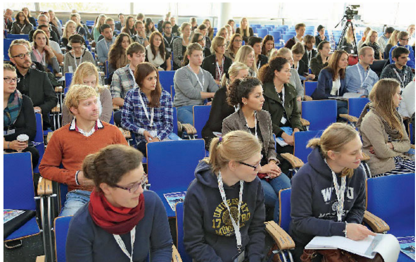
Abbildung 1 Das Programm vom Studententag im letzten Jahr war sehr gut besucht.