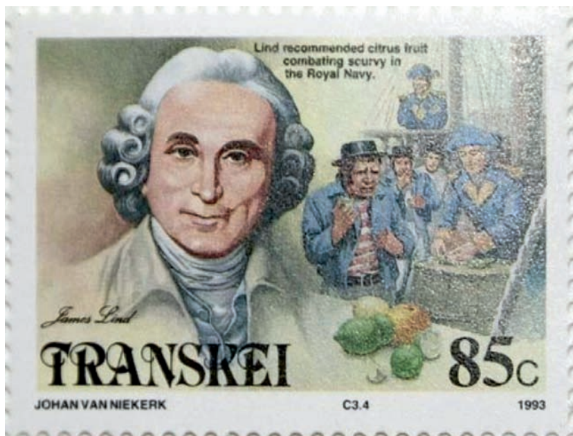
Abbildung 1 Briefmarke aus der (früheren) Transkei, Südafrika (1993), zu Ehren von James Lind.

ten, ohne dass ihr Nutzen für den individuellen Patienten sicher durch verlässliche Studien belegt gewesen wäre. Exemplarisch kann hier die Hormonersatztherapie für Frauen in der Menopause oder die Anwendung von Antiarrhythmika bei Patienten mit Herzinfarkt genannt werden [2, 6, 8]. Kritisches Hinterfragen der Wirksamkeit medizinischer Behandlungen ist eine Eigenschaft, die jeder gute Arzt und Zahnarzt nicht nur haben, sondern auch sich er-