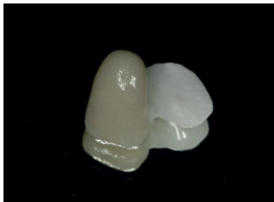
Abbildung 1a Vollkeramische Adhäsivbrücke aus verblendeter Zirkonoxidkeramik.