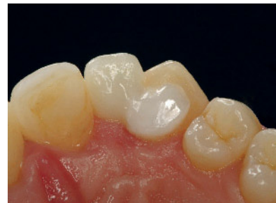
Abbildung 1c Vollkeramische Adhäsivbrücke von oral.

werden, ob alternativ eine Behandlung mittels Restaurationen aus Metall möglich und akzeptabel ist. Ist eine keramische Versorgung ausdrücklich gewünscht, sollte bei Patienten mit Bruxismus geprüft werden, ob alternativ eine Behandlung mittels monolithischer Restaurationen (siehe vorher beschriebene Empfehlungen) möglich und akzeptabel ist,