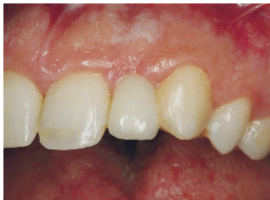
Abbildung 1b Vollkeramische Adhäsivbrücke von labial.