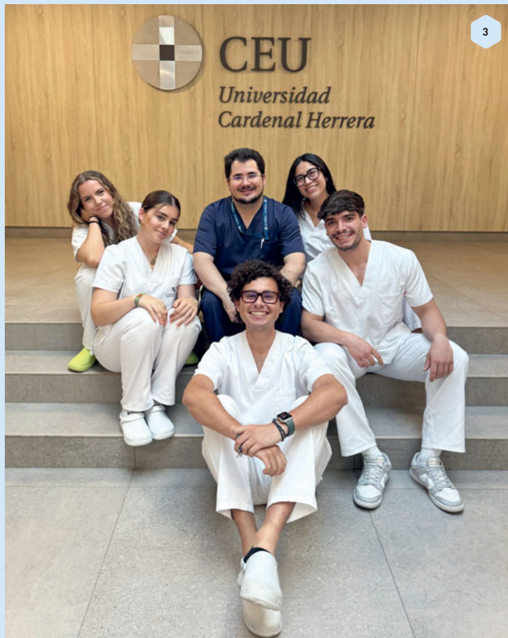
Abb. 1 Die Zahnklinik und das Gebäude in dem Vorlesungen und preclinics stattfinden.