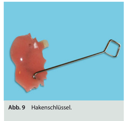
Abb. 9 Hakenschlüssel.