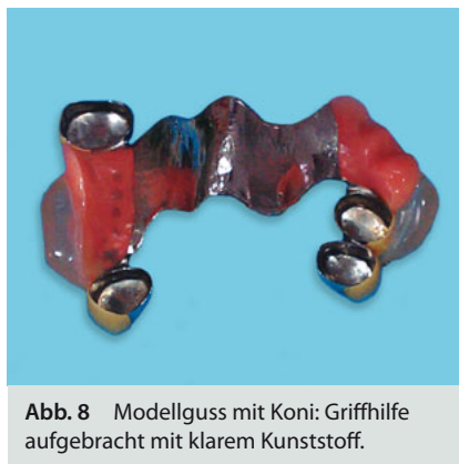
Abb. 8 Modellguss mit Koni: Griffhilfe aufgebracht mit klarem Kunststoff.