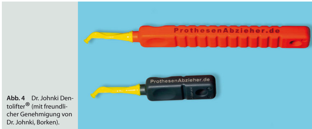
Abb. 4 Dr. Johnki Dentolifter®.