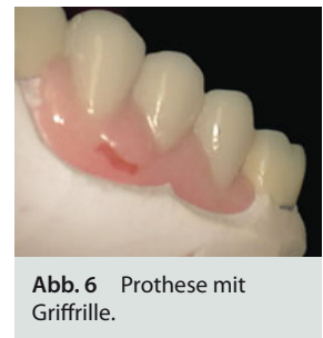
Abb. 6 Prothese mit Griffrihle.