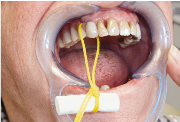
Abb. 2 Ausgliedern mit interdental eingeführter Zahnseide in der Praxis.