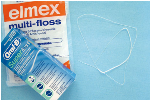
Abb. 1 Materialbeispiele Oral B® Superfloss® (Procter & Gamble Service GmbH, Schwalbach am Taunus) und elmex® multi-floss (CP GABA GmbH, Hamburg).