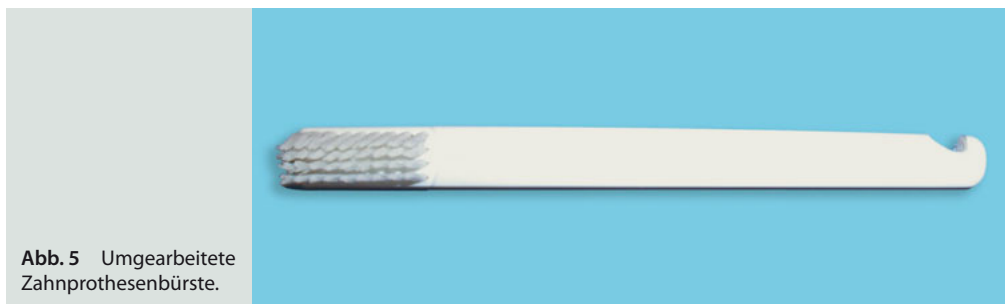
Abb. 5 Umgearbeitete Zahnprothesenbürste.