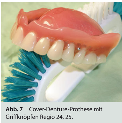
Abb. 7 Cover-Denture-Prothese mit Griffknöpfen Regio 24, 25.