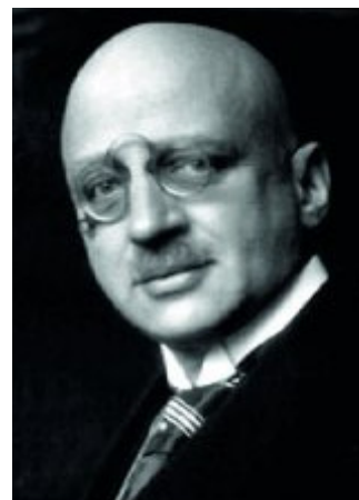
Abbildung 3 Prof. Dr. Fritz Haber (1868–1934).

– Die 1920 auf Initiative des Chemie-Nobelpreisträgers Prof. Dr. Fritz Haber (Abb. 3) als Notgemeinschaft der Deutschen Wissenschaft gegründete Gesellschaft wird in Deutsche Gemeinschaft zur Erhaltung und Förderung der Forschung , kurz: Forschungsgemeinschaft umbenannt.