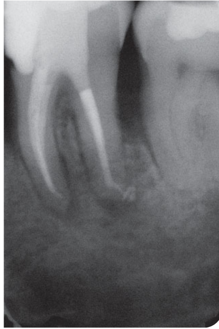
Abb. 3 Postoperatives Röntgenbild.