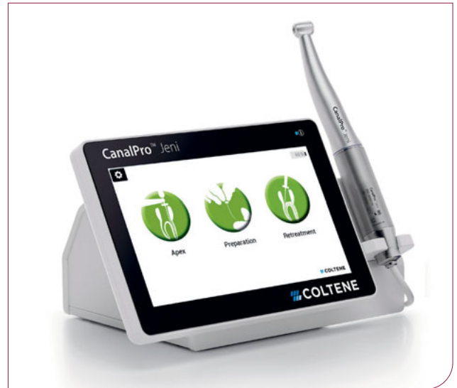
Abb. 1 Vollautomatischer Endomotor.

seit 2020 erhältliche Gerät war Eugenio so stolz, dass er dem neuartigen Endomotor sogar seinen persönlichen Spitznamen weitergab: Der „bezaubernde Jeni“ findet seither selbstständig den Weg durch den Wurzelkanal und passt die Feilenbewegung den Gegebenheiten auf dem jeweiligen Streckenabschnitt innerhalb von Millisekunden an (Abb. 1).