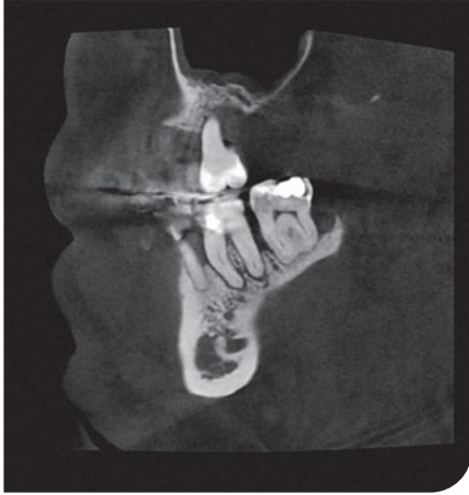
Abb. 2 Präoperative Röntgenaufnahme Zahn 37, Fall 1.