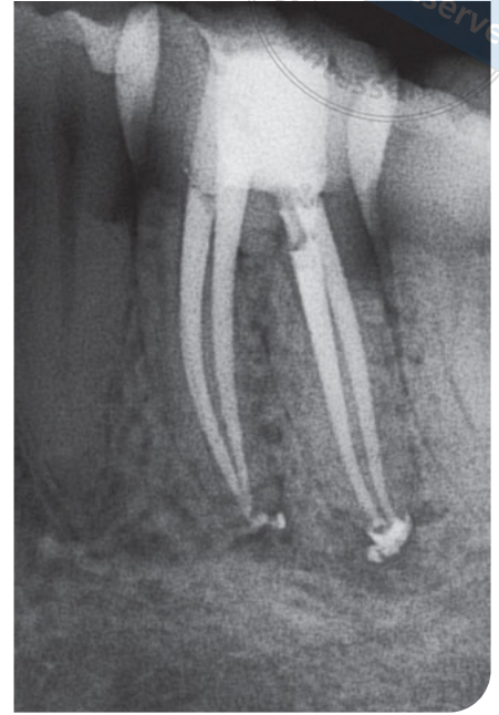
Abb. 5 und 6 Postoperative Röntgenbilder.

ebenfalls aufgrund einer apikalen Parodontitis in Zahn 36 die Entfernung der insuffizienten Guttaperchafüllung notwendig (Abb. 4). Mit einer Geschwindigkeit von 1.000 U/Min. bei kontinuierlicher Rotation wurde eine filigrane MicroMega Remover-Feile über zwei Drittel des Kanals eingeführt. Anschließend wurde der Rest der distalen Wurzel mit einer HyFlex EDM OneFile im Winkelstück bei 500 U/Min. behandelt. In den mesialen Kanälen kamen HyFlex EDM-Feilen der Größe 20/05 zum Einsatz. Die Drehzahl betrug ebenfalls 500 U/Min. Für die finale Kanalausformung kam dann die 25/-HyFlex EDM OneFile in den mesialen Kanälen zum Einsatz. Im distalen Kanal wurde eine EDM-Feile Größe 40 mit Taper 04 verwendet. Das Ergebnis auf dem Röntgenbild verspricht eine langlebigere Obturation als die Erstbehandlung fünf Jahre zuvor (Abb. 5 und 6).