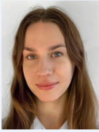
Chiara Henrich Steinbart-Gymnasium, Duisburg