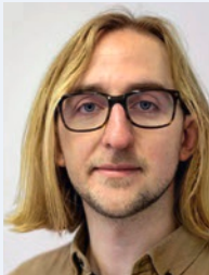
Sebastian Thon Steinbart-Gymnasium, Duisburg