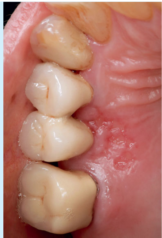
Abb. 2 78-jährige Patientin, erste intraorale Manifestation des Herpes Zoster (Anfangsstadium).