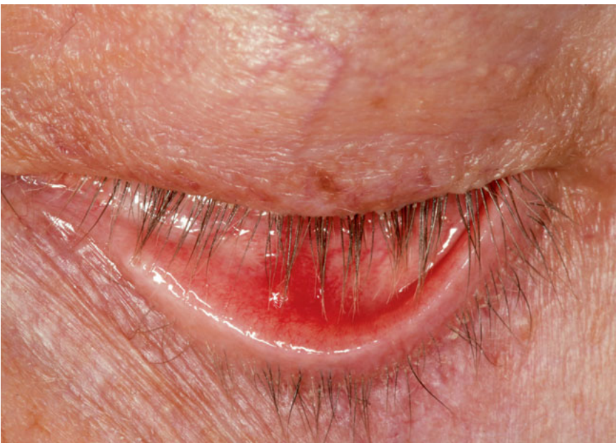
Abb. 5 59-jährige Patientin, Herpes Zoster ophthalmicus.

Eine häufig auftretende (ca. 20 %) schwerwiegende Komplikation stellt die Post-Zoster-Neuralgie dar 3 , welche nur durch die rechtzeitige Therapieeinleitung vermieden werden kann. Da gerade bei älteren Patienten häufig Rezidive auftreten, klingt die neue Impfung vielversprechend. Sie soll Rezidiven zu 90–92 % vorbeugen und auch das Risiko für postherpetische Neuralgien senken 1 . Die Impfung wird von der STIKO für alle Patienten ab 60 und alle immungeschwächten Patienten ab 50 Jahren empfohlen. Eine entsprechende Beratung seitens des aufmerksamen Zahnarztes kann den Patienten Anreiz