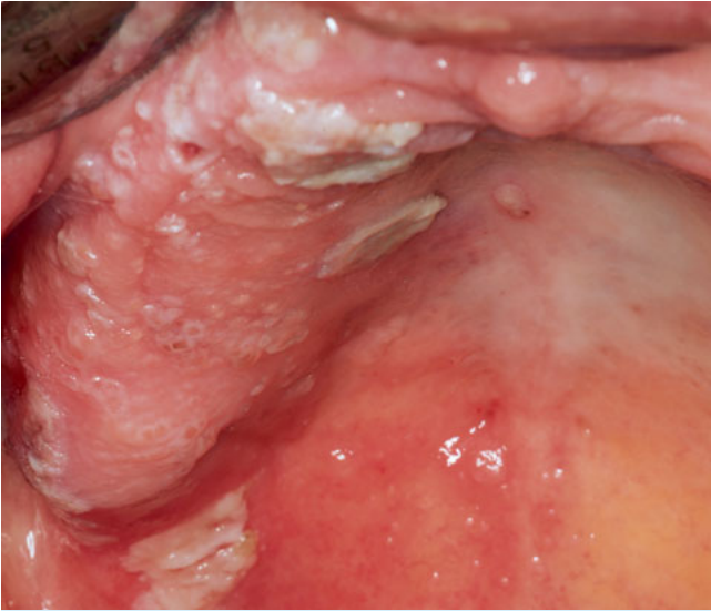
Abb. 3 89-jährige Patientin, fortgeschrittenes Stadium des Herpes Zoster (etwa 4–5 Tage).