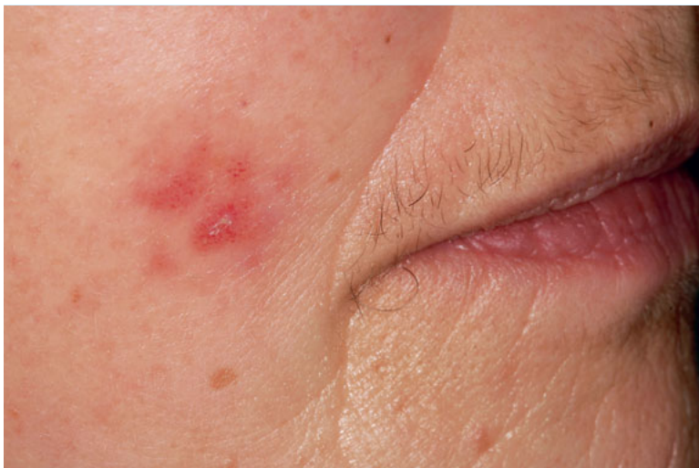
Abb. 1 74-jährige Patientin, 1-2 Tage nach dem ersten Auftreten des Herpes Zoster (Anfangsstadium).

Die rasche Einleitung einer Therapie (innerhalb der ersten 72 Stunden) 4 ist