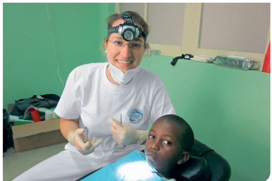
Abb. 2 Ein Großteil meiner Patienten waren Kinder und Jugendliche.

uns abwechselnd gegenseitig. Mittags gönnten wir uns eine kleine Auszeit und nutzen diese auch zur Sterilisation unserer Instrumente in einer Schimmelbusch-Trommel.