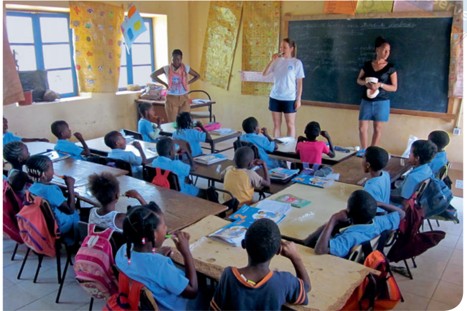
Abb. 4 Am letzten Tag stand ein Schulbesuch für die Gruppenprophylaxe an.

Der Patientenansturm war enorm, sodass wir die tägliche Patientenzahl auf 30 begrenzen mussten. Überraschenderweise sahen wir wenige Akutfälle und leiteten antibiotische Abschirmung eher aufgrund hygienischer Aspekte ein.