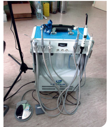
Abb. 1 Eine unserer mobilen Behandlungseinheiten.

Wir arbeiteten an neun Arbeitstagen jeweils acht bis neun Stunden an zwei Behandlungsplätzen und assistierten