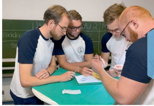
Bei der Geschicklichkeitsprüfung.