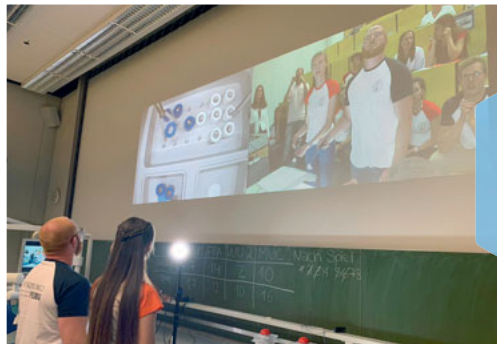
Indirektes Arbeiten wurde mit der Laparoskopie geprüft.