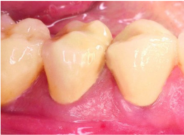
Abbildung 1 Krone 44, 45 baseline.