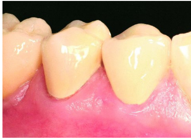
Abbildung 2 Krone 44, 45 nach sechs Monaten.

Neue selbstadhäsive Befestigungsmaterialien, die in die Gruppe der Kompositzemente [8] eingeteilt werden, wurden von verschiedenen Herstellern entwickelt. Wegen ihrer verbesserten physikalischen Eigenschaften [12] gegenüber den konventionellen Befestigungszementen erlangten diese selbstadhäsiven Befestigungsmaterialien in den letzten Jahren zunehmende Popularität. Im Vergleich zu den konventionellen adhäsiven Kompositzementen haben die selbstadhäsiven Befestigungsmaterialien eine vereinfachte klinische Handhabung. Unter relativer Trockenlegung des Arbeitsgebietes wird auf ein separates Aufbringen von Adhäsiven oder Bondingmaterialien der Zahnhartsubstanz verzichtet. Für die Langlebigkeit einer definitiven Restauration sind ebenfalls die physikalischen Parameter, besonders der Haftwert des verwendeten Befestigungsmaterials [10, 35], entscheidend. In In-vitro-Versuchen wurden gute Haftwerte auf Metalllegierungen, Zirkonoxid- und Glaske-