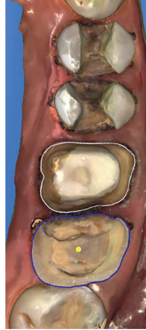
Abbildung 4 Digitaler Scan der Präparationen Figure 4 Optical impression of the preparations