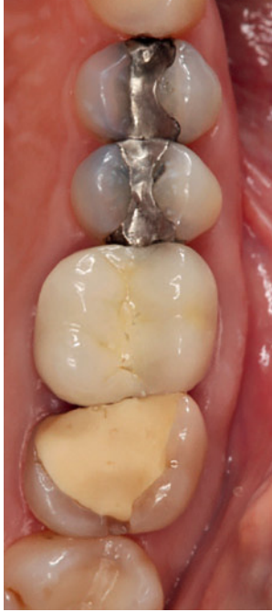
Abbildung 2 Ausgangssituation mit insuffizienten Füllungen und Restauration im 2. Quadranten Figure 2 Initial situation: insufficient fillings and restorations