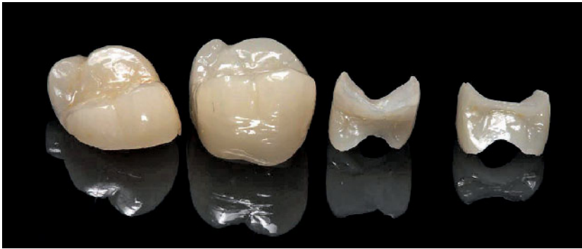
Abbildung 6 „Hybridkeramische“ Restaurationen nach Fertigstellung und Politur Figure 6 Polymer-infiltrated ceramic restorations after polishing

relativ gering. Neben einigen Falldarstellungen [8, 21] sind derzeit nur 2 klinische Studien [3, 26] veröffentlicht, die über einen mittleren Beobachtungsraum von 2 Jahren berichten.