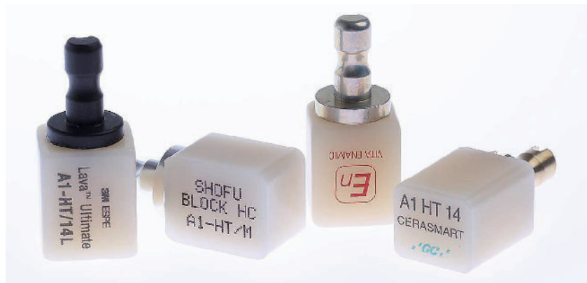
Abbildung 1 CAD/CAM-Blöcke der derzeit verfügbaren Komposit-Matrix-Keramiken Figure 1 Current available resin-matrix ceramics CAD/CAM blocks

kristallinen Oxidkeramiken, ästhetischem Lithiumdisilikat oder Hochleistungspolymeren gewählt werden. Während sowohl Zirkondioxid- als auch Lithiumdisilikatkeramiken in einem vorgesinterten Zustand gefräst und geschliffen werden und nachfolgend dichtgesintert werden müssen, bieten sich mit der Markteinführung von innovativen Komposit-Matrix-Keramiken neue Behandlungsmodalitäten für die CAD/CAM-Technologie. Komposit-Matrix-Keramiken werden als CAD/CAM-Blöcke in ihrer endgültigen Form geschliffen und bestehen aus einem Keramik-/Komposit-Gemisch, die die positiven Eigenschaften beider Werkstoffklassen in sich zu vereinen versuchen [22]. Komposit-Matrix-Keramiken lassen sich anhand ihres industriellen Polymerisationsmodus, der entweder allein unter hohen Temperaturen (HT) oder einer Kombination aus hohen Temperaturen und hohem Druck (HT/HP) stattfinden kann, in CAD/CAM-Komposite (HT) mit dispersen Füllern und einer vornehmlich organischen Phase und polymerinfiltrierte Keramiken (HT/HP) (kommerzieller Name: „Hybridkeramiken“) mit einer dominanten anorganischen Phase einteilen [12]. Abbildung 1 zeigt die vier derzeit verfügbaren Komposit-Matrix-Keramiken und Tabelle 1 gibt eine Übersicht über die materialspezifischen Zusammensetzung nach [1] und [11].