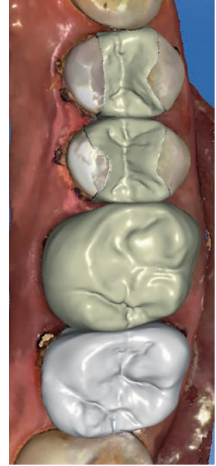
Abbildung 5 Digitaler Designvorschlag der Polymer-infiltrierten Restaurationen Figure 5 Digital design of polymer-infiltrated restorations

nen mögliche Risse, die bei normaler Kaubelastung oder bei klinischer Anpassung entstehen, an den Polymergrenzflächen abgelenkt werden. Durch diesen „Verstärkungsmechanismus“ können Risse maßgeblich abgeschwächt werden [4].