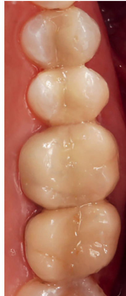
Abbildung 7 Eingegliederte Polymer-infiltrierte Keramikrestaurationen unmittelbar nach adhäsiver Zementierung Figure 7 Clinical situation immediately after cementation of Enamic restorations

Eine 45-jährige Patientin stellte sich mit dem Wunsch nach Sanierung vor. Abbildung 2 zeigt die Ausgangssituation mit insuffizienten Amalgam- und Kompositfüllungen an den Zähnen 24, 25 und 27. Des Weiteren zeigte die Krone an 26 einen deutlich tastbaren Randspalt, welcher bereits zu einer Sekundärkaries am Rand geführt hatte. Zunächst wurde der 2. Quadrant konservierend mit Aufbau-füllungen (Clearfil Core/New Bond, Kuraray Co. Ltd., Chiyoda, Japan) vorbehandelt und der Zahn 26 nach Abnahme der insuffizienten Krone einer endodontischen Revisionsbehandlung beim Spezialisten unterzogen. Nachfolgend wurden die Zähne 24, 25 und 27 für minimalinvasive Inlays und Onlays defektorientiert und keramikgerecht präpariert. Es wurde hierbei streng darauf geachtet, dass alle Innenkanten abgerundet wurden und ein weicher Präparati-