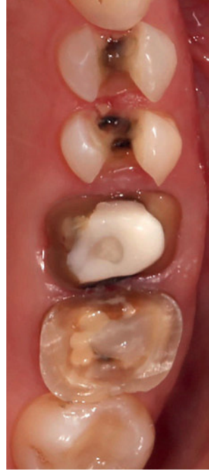
Abbildung 3 Keramikgerechte Präparationen Figure 3 Minimal invasive preparations