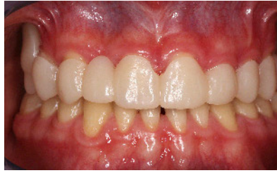
Abbildung 4 Therapeutische Schiene nach Eingliederung. Durch diese reversible Rekonstruktion kann eine ausgedehnte, provisorische Phase genutzt werden, um die notwendige Implantation hinaus zu zögern.