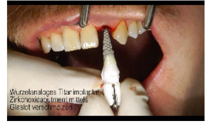
Abbildung 5 Wurzelanaloges Titanimplantat mit Zirkonoxid-Abutment, mit Glaslot verschmolzen. Die Oberfläche des Titanteils begünstigt das Einwachsen von Knochensubstanz.

der Zahnheilkunde“ ausgeschrieben. Zahnärzte, Wissenschaftler, Werkstoffexperten, Zahntechniker und besonders interdisziplinäre Arbeitsgruppen sind zur Teilnahme eingeladen. Im Rahmen des Themas „Restaurations-Keramiken und Hybridwerkstoffe zur konservierenden und prothetischen Zahnversorgung“ werden wissenschaftliche, klinische und materialtechnische Untersuchungen angenommen, die auch die zahntechnische Ausführung im Dentallabor einbeziehen. Deshalb können auch Zahntechniker als Teammitglieder teilnehmen. Die einzureichenden Arbeiten können folgende Schwerpunkte haben: