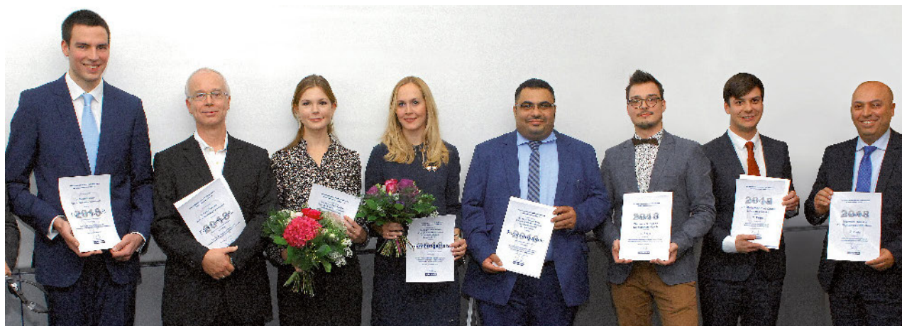
(Abb. 1: AG Keramik)

Forschungs- und Videopreis: Ab 30. Juni 2019 werden progressive Konzepte belohnt.