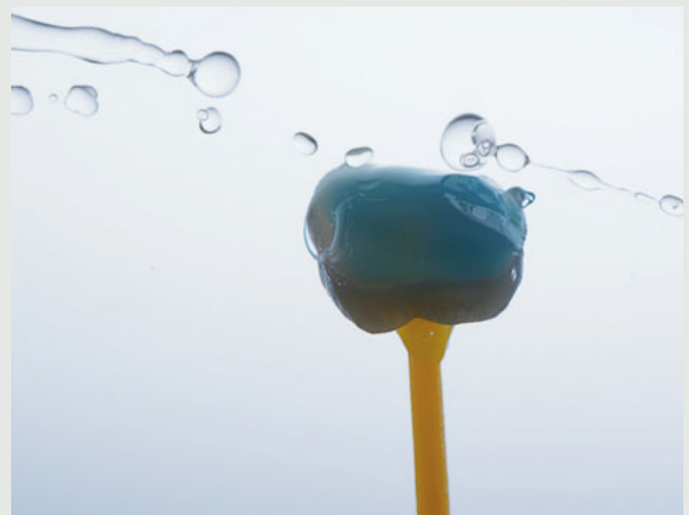
1. Platz: Carme Riera

meisten Betrachtern als harmonisch empfunden werden, können wir einige solcher universalen Prinzipien beachten. Hierzu zählen z. B. Führungslinien, die Drittelregel, Dreieckskompositionen, ungerade Anzahlen oder auch Symmetriebrüche 1 . Im Gegensatz hierzu ist die dentale Fotografie übrigens nicht künstlerischen Prinzipien, sondern Leitlinien und Normen verpflichtet 2 , die jedoch aktualisiert werden müssten.