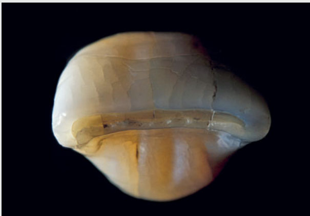
3. Platz: Luc und Patrick Rutten

In diesem Jahr veranstaltete die European Academy of Esthetic Dentistry (EAED) erstmals einen Fotowettbewerb. Hierzu wurden alle Teilnehmer des Kongresses im Mai eingeladen, Bilder mit Bezug zur Zahnmedizin einzureichen, wofür keine bestimmten Regeln vorgegeben waren. Nach einer Vorauswahl durch eine Jury wählten alle Kongressmitglieder ihr bestes Bild. Die Fotografien auf den Plätzen eins bis drei sind hier abgedruckt, können aber auch online unter http://milan.eaed.org/photo-contest/ angeschaut werden.