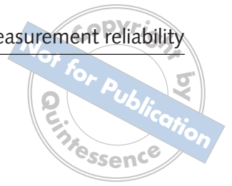
Table 1 Synoptical table of the investigated motor tasks.