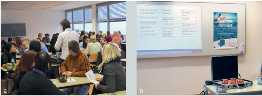
Abb. 3a und b Der Theorietag.

Am Ende der beiden Praktikumstage verfassten alle Teilnehmer einen schriftlichen Bericht. Ein abschließender Fragebogen half bei der finalen Auswertung.