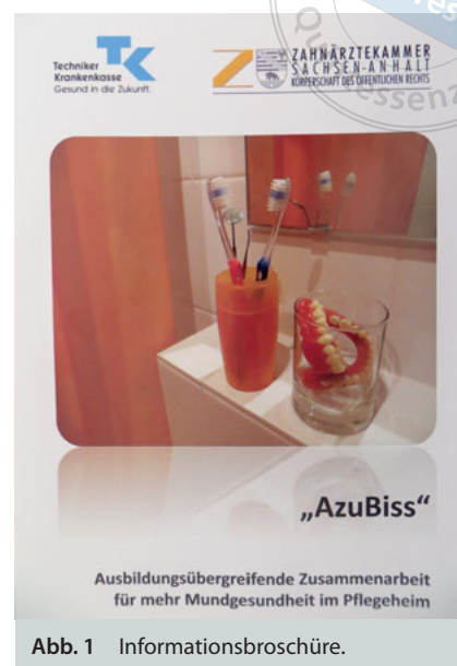
Abb. 1 Informationsbroschüre.

Bei der Befragung der AP-Auszubildenden beantworteten sieben männliche und 33 weibliche Auszubildende die Fragen. Ein Teilnehmer wollte sein Geschlecht nicht angeben. Alle 41 Azu-