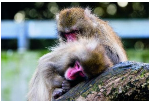
Beispiel eines Fotos zum Begriff „Zuwendung“.