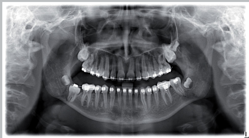
Abb. 1: Orthopantomogramm der Patientin im Alter von 15 Jahren mit inkorporierter, festsitzender kieferorthopädischer Apparatur (2013)