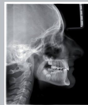
Abb. 3: Fernröntgenseitenaufnahme der Patientin im Alter von 18 Jahren (2016)