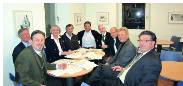
Abbildung 2 Task Force Algorithmus mit Zahnmedizinern und Schlafmedizinern, Mathematikum Gießen.