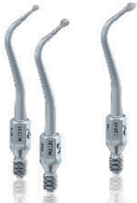
Micro SF(8)M/D und Bevel Spitzen SF(8)S/D

Komet bereichert die beliebte Sonic-Line um sechs Micro/Bevel-Spitzen und vier Schallspitzen für die Kronenstumpfpräparation. Die Micro/Bevel-Spitzen mit ihren filigranen Arbeitsteilen sind sie für kleine, schwer zugängliche Läsionen konzipiert. Bei den Micro-Spitzen stehen eine kleine (Größe 016) und große Halbkugel (Größe 024) zur Auswahl.