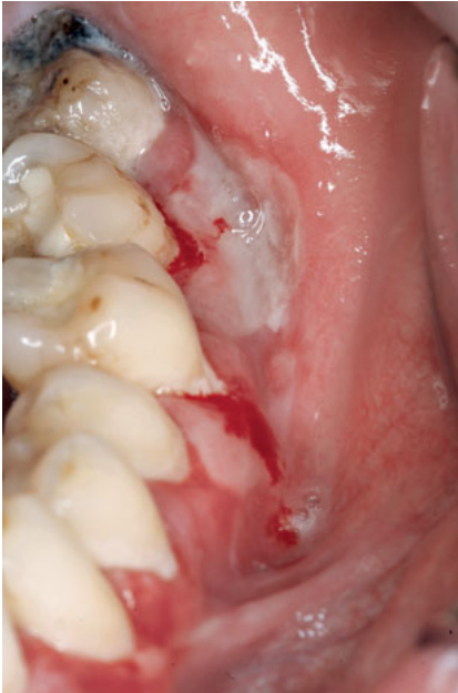
Abb. 3 46-jähriger Patient mit vernarbendem Schleimhautpemphigoid.