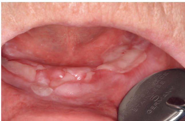
Abb. 1 Zahnlose 83-jährige Patientin mit bullösem Pemphigoid.

Das Ausbleiben des Nikolski-Phänomens I (mechanische Provokation einer Blasenneubildung, beispielsweise mittels Luftbläser) hilft beim Ausschluss der Diagnose des äußerst seltenen Pemphigus vulgaris (Abb. 4), das Ausbleiben des Nikolski-Phänomens II (Verschieben einer Blase) liegt jedoch an der Beschaffenheit der oralen Mukosa und wäre an anderen Körperstellen bei Blasenbildung provozierbar. Es kann also nicht zur definitiven Diagnosestellung des BP oder VSP im oralen Bereich herangezogen werden. Differenzialdiagnostisch muss auch der bullöse Lichen (Abb. 5) ausgeschlossen werden. Eine Diagnose