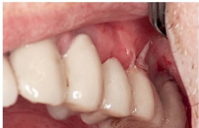
Abb. 2 77-jähriger Patient mit bisher nur extraoral aufgetretenem bullösem Pemphigoid.