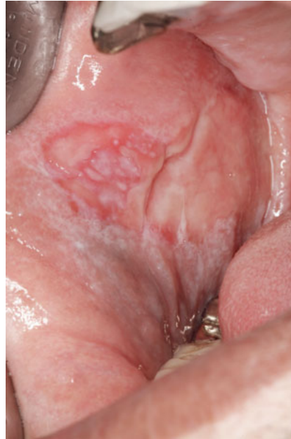
Abb. 4 54-jähriger Patient mit Pemphigus vulgaris.

des BP oder VSP kann also nur histopathologisch mit Unterstützung durch Immunfluoreszenz gestellt werden: Die Probenentnahme ist aufgrund der raschen Epithelablösung schwierig, es sollte im Randbereich einer Läsion biopsiert werden.