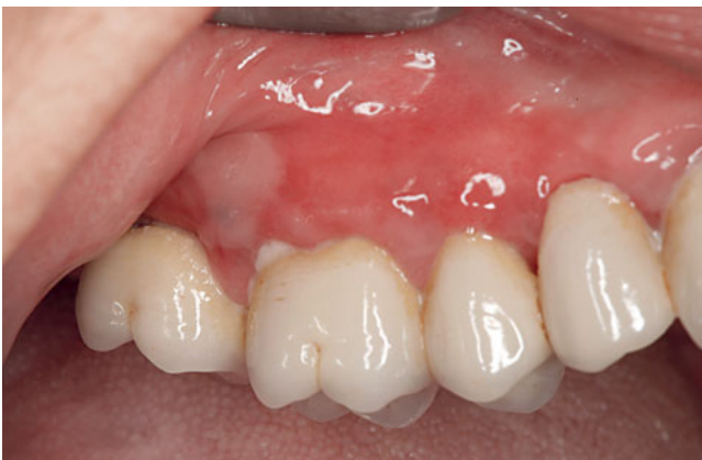
Abb. 5 53-jährige Patientin mit bullösem Lichen.

Beide Autoimmundermatosen treten schubweise auf, welche dann zunächst entsprechend hochdosiert therapiert werden müssen. Häufig treten Rezidive nach dem Absetzen der glukokortikoidhaltigen Salben, Spülungen oder systemischen Therapie auf, meist lassen sich beide Erkrankungen jedoch mittels geeigneter, möglichst niedrig dosierter glukokortikoidhaltiger Therapie zufriedenstellend therapieren (Tab. 1).