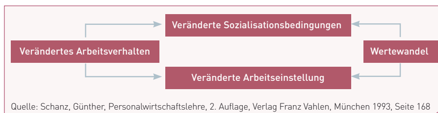
Abb. 1 Wertewandel und Arbeitsverhalten. 4

Konsequente und regelmäßige Teambesprechungen fördern das Mitspracherecht und die Motivation der Mitarbeiter. Jeweils mindestens zwei Tage vor dem Meeting, bei uns Teamtalk genannt, darf jeder Mitarbeiter schriftlich Probleme oder Ideen einreichen, die dann zu besprechen sind. Damit werden die Mitarbeiter motiviert, am Praxiserfolg teilzuhaben und aktiv das Praxisgeschehen und den Umsatz mitzugestalten. Die Praxisinhaberin kommuniziert offen und für jeden verständlich klare Ziele und Werte der Praxis. Damit können wir uns sozusagen von der Konkurrenz abheben und die Mitarbeiter können stolz sein, in dem und für das Unternehmen Zahnarztpra-